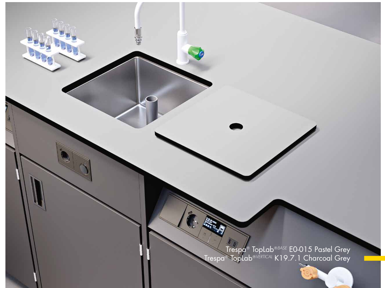
Trespa® TopLab®BASE E0-015 Pastel Grey Trespa® TopLab®VERTICAL K19.7.1 Charcoal Grey

Commandez vos échantillons sans plus attendre!