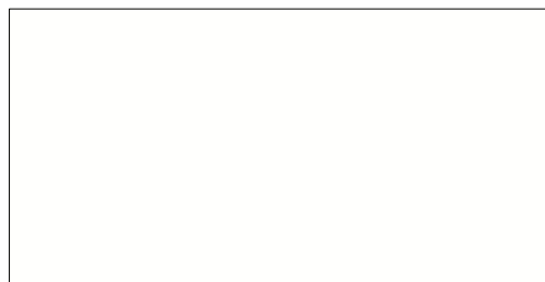
A05.0.0 – Pure White

Die Platten können als Formatplatten oder auf Mass zugeschnitten und fertig konfektioniert bezogen werden. Bei uns erhalten Sie auch die passenden Schrauben, Nieten und Zubehöre für Ihre Fassade.